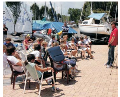
Zum Vielseitigkeits-Cup (V-Cup) am ersten Juli-Wochenende waren 20 Jüngste aus drei Bootsklassen in den Leistungsstützpunkten nach Überlingen eingeladen worden. Im Vordergrund stand dabei nicht nur das seglerische Können, sondern auch theoretische und sportliche Fähigkeiten der jungen Segler. Das Landesleistungszentrum veranstaltete den V-Cup nach 2010 nun bereits zum zweiten Mal.